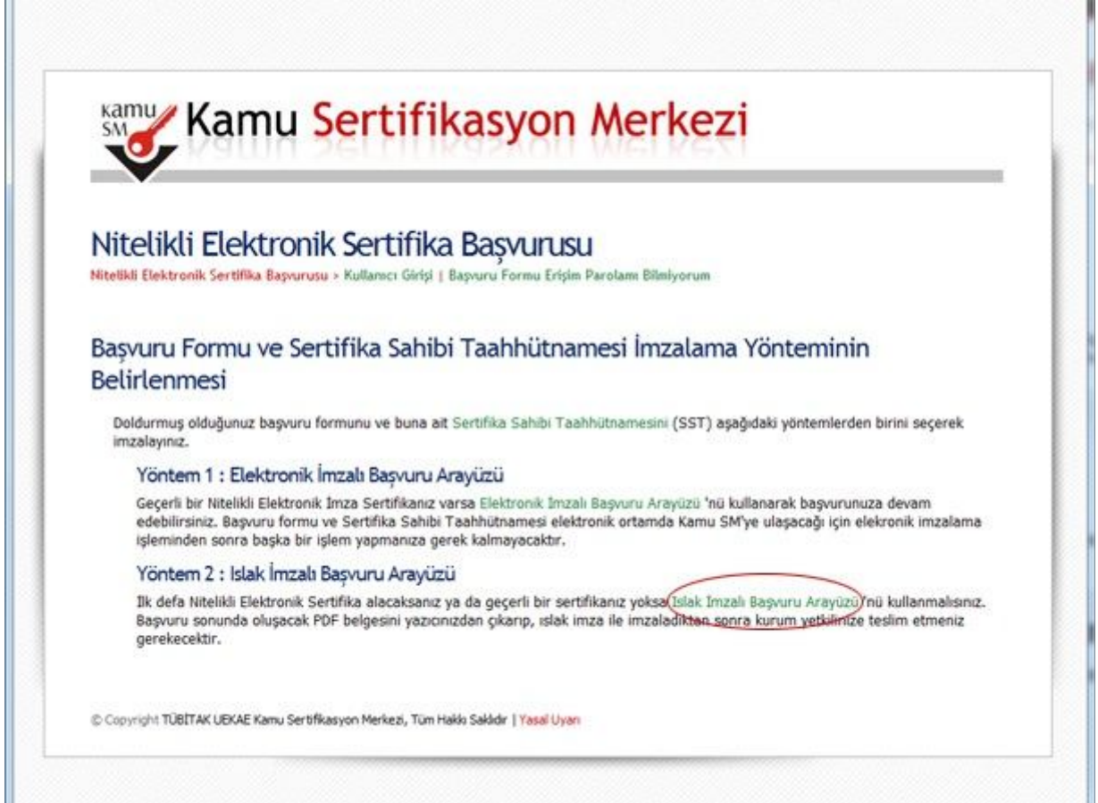
Őekil 7. İmzalama Yönteminin Belirlenmesi

KarŐınıza gelecek olan ekranda doldurmuş olduĐunuz BaŐvuru Formunu ve Sertifika Sahibi Taahhütnamesini hangi yöntemle imzalamak istediĐiniz seçilir. Geçerli bir Nitelikli Elektronik Sertifikası olmayan kullanıcılar İmzalama yöntemi olarak Islak İmzalı BaŐvuru Arayüzü'nü seçer(Bkz. Őekil 7).